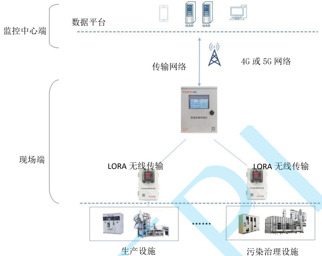
图 4-1 用电量监控系统组成示意图